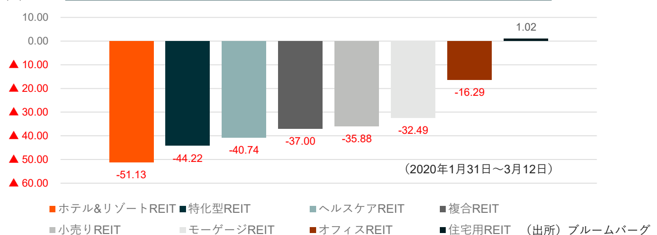
図3：各セクターのREITの下落率（当ファンドのポートフォリオ内）

さらに全体として、世界的なリスク資産の保有からの逃避行動、いわゆるリスクオフの動き、極端なグローバル株式市場の変動性の高まりなども重なり、短期的に価格の大幅下落をもたらしました。